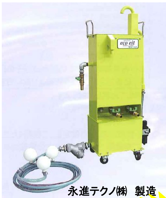
永進テクノ(株) 製造