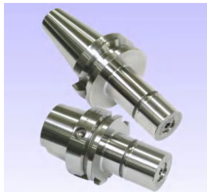
ツ ー リ ン グ