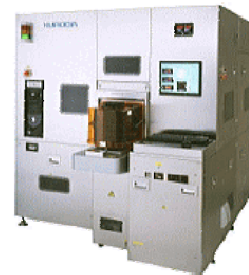
精 密 測 定 機 器