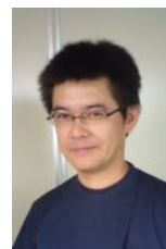
北関東支社 中立課長

■ 今回御紹介致しますのが北関東支社の中立課長です。 中立課長は油業界歴20年、大の中日ファンであります。日頃御客様への商品の配送、受発注、肉体労働である更油作業など縁の下の力となって日々業務を行っております