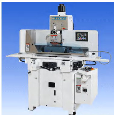
工 作 機 械